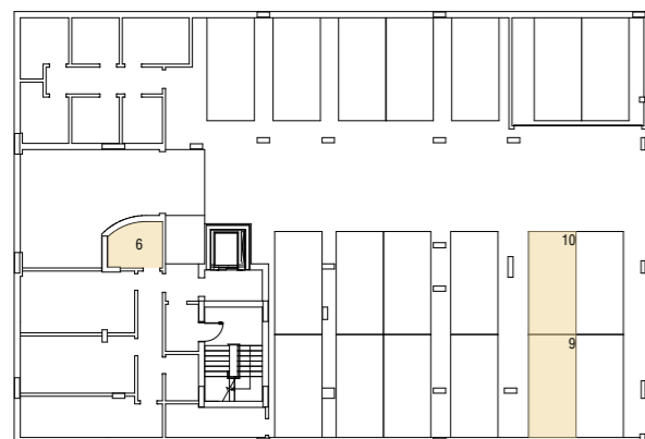
Piso -1 | Estacionamento N°9 e N°10 Arrecadação N°6 - 3,60m 2